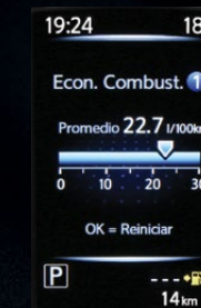
ECONOMÍA DE COMBUSTIBLE