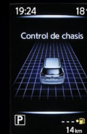
CONTROL DE CHASIS

Direcciones paso a paso, identificador de llamadas, funciones de seguridad disponibles... Toda la información frente a tus ojos en el Nissan Advanced Drive-Assist Display para el conductor en una pantalla a color de 5". Usa los controles al volante para navegar entre las diferentes pantallas, sólo se necesita un clic en las flechas. ¡Así de fácil!